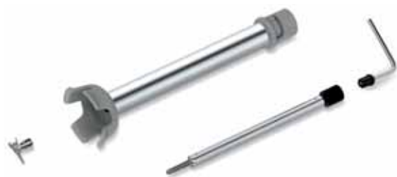
Coltelli smontabili Removable knives