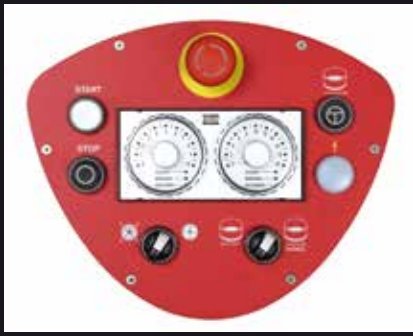
Pannello comandi standard Standard control panel