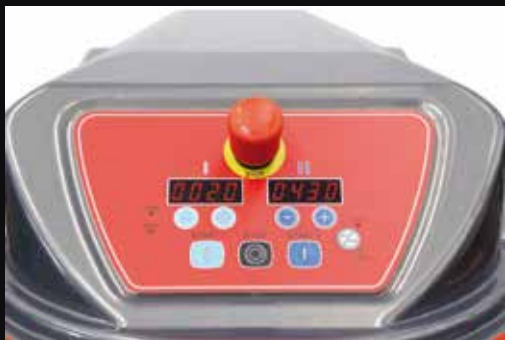
Pannello digitale/ Digital control panel